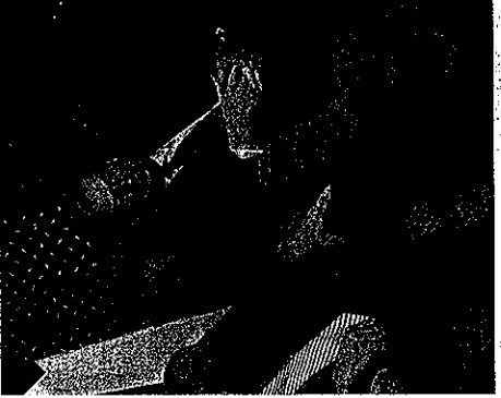
t de la sortie de Ségolène Roy.