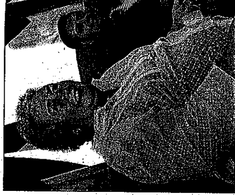
Les trois députés bloquistes de Laval se réjouissent